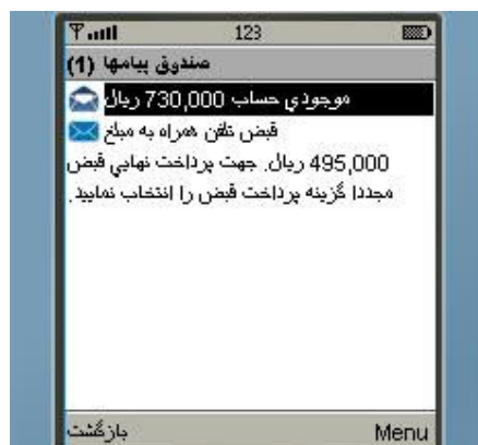
شکل شماره ۸

توجه : کلیه پیامهای دریافتی از سیستم در منوی "صندوق پیامها" قرار می‌گیرند. (شکل شماره ۸)