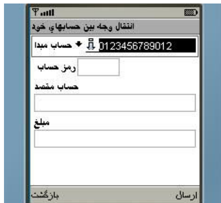
شکل شماره ۱۳

مشابه دریافت مانده حساب می باشد (شکل شماره ۱۳)