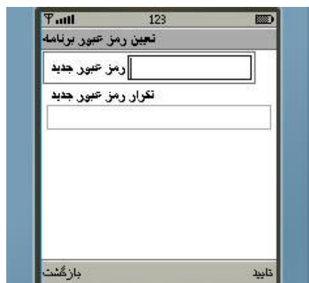
شکل شماره ۱

۵- در مرتبه اول اجرا ، وارد مرحله تعیین رمز عبور برنامه می شوید (شکل شماره ۲). در این قسمت باید رمز عبوری بین ۳ تا ۹ رقم تعریف نمایید.