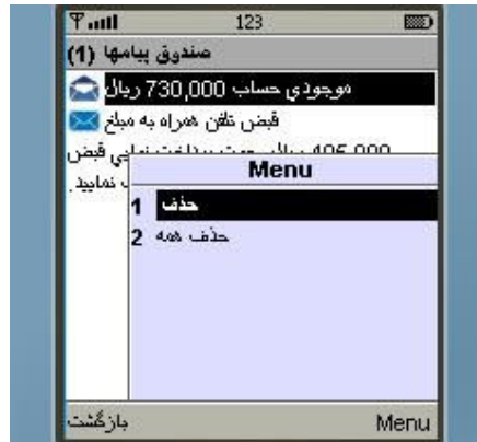
شکل شماره ۲۴

دومین منوی اصلی (منوی صندوق پیام‌ها) فضایی است که کلیه پیامهای دریافتی شما در آن قرار دارند (رجوع به شکل شماره ۸). در این قسمت شما می‌توانید متن پیامها را ملاحظه نموده و در صورت تمایل هر یک و یا همگی آنها را حذف نمایید (شکل شماره ۲۴).