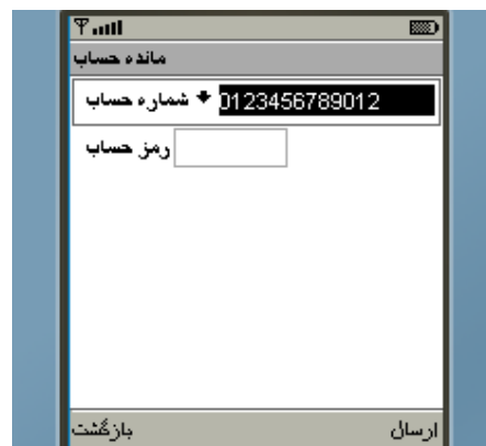
شکل شماره ۱۱