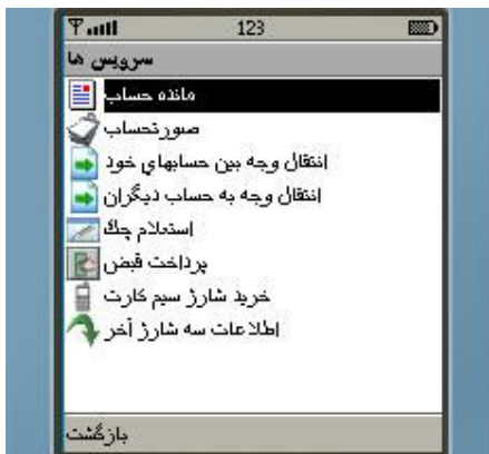
شکل شماره ۱۰

بروز رسانی اطلاعات حسابهای ثبت شده قبلی و نیز ثبت حساب جدید باعث می‌شوند تا تمامی خدماتی که بر روی حسابهای شما قابلیت اجرا دارند از طریق منوی سرویسها مشاهده شوند (پیش از بروز رسانی و یا ثبت حساب، در این منو تنها سرویسهای پرداخت قبض، خرید شارژ سیم کارت اعتباری و دریافت اطلاعات شارژ سیم کارت دیده می‌شوند).