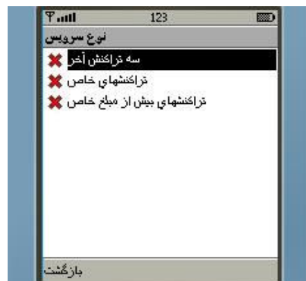
شکل شماره ۳۱