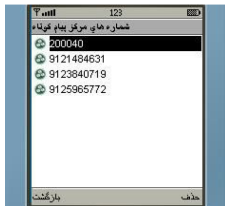
شکل شماره ۳۵

✓ گزینه سوم "شماره‌های مرکز پیام کوتاه": این شماره‌ها دریافت کننده درخواستهای شما می‌باشند.