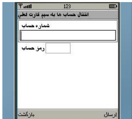
شکل شماره ۲۵