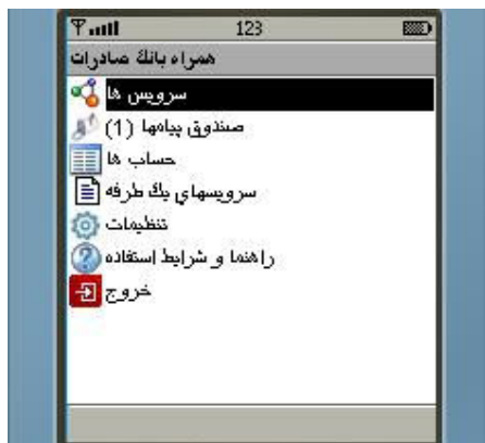
شکل شماره ۴