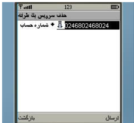
شکل شماره ۳۲

➤ گزینه سوم "حذف سرویس یکطرفه" : برای غیر فعال نمودن سرویس یکطرفه ، از طریق این گزینه ابتدا نوع سرویس (شکل شماره ۳۱) و پس از آن حساب مورد نظر را از کادر شماره حساب انتخاب نموده و درخواست خود را ارسال نمایید (شکل شماره ۳۲).