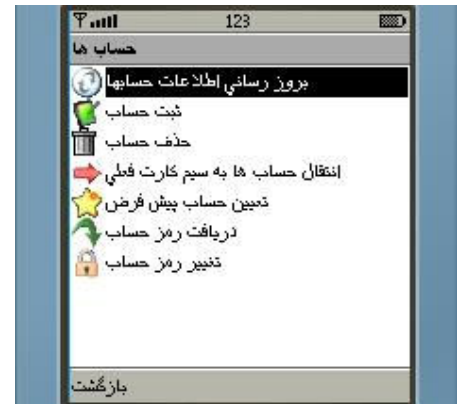
شکل شماره ۵