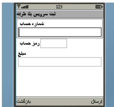
شکل شماره ۳۰

۳- "تراکنشهای بیش از مبلغ خاص"، این سرویس گردشهای با مبلغ برابر و یا بیشتر از مبلغ انتخابی شما در زمان ثبت نام بر روی حساب مورد نظرتان را به صورت خودکار در پایان روز کاری ارسال می‌کند. طریقه ثبت نام مشابه سرویسهای قبلی بوده با این تفاوت که در کادر آخر، مبلغ مشخص می‌گردد. حداقل مبلغ قابل قبول جهت فعال سازی این سرویس یک میلیون ریال می‌باشد (شکل شماره ۳۰).