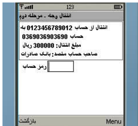
شکل شماره ۱۶