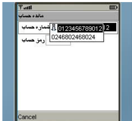
شکل شماره ۱۲