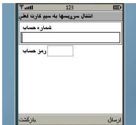
شکل شماره ۳۳

➤ گزینه چهارم "انتقال سرویسها به سیم کارت فعلی" : به منظور منتقل نمودن سرویسهای یکطرفه ثبت نام شده قبلی به سیم کارت دیگر ، ابتدا سیم کارت جدید را در گوشی تلفن همراه خود قرار داده و پس از اجرای همراه بانک ، از طریق این گزینه شماره و رمز یکی از حسابهای خود را درج و درخواست خود را ارسال نمایید. در صورت صحت اطلاعات وارد شده ، کلید سرویسهای یکطرفه فعال شده بر روی سیم کارت اولیه به سیم کارت جدید منتقل می گردد (شکل شماره ۳۳).