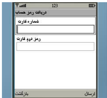
شکل شماره ۲۶