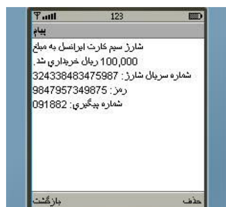
شکل شماره ۲۲

با ارسال درخواست ، سیستم پیامی حاوی رمز شارژ به کاربر ارسال می‌نماید (شکل شماره ۲۳) که با درج آن در گوشی مطابق با دستورالعمل شارژ اپراتور ایرانسل ، سیم کارت شارژ می‌گردد. چنانچه با انجام این موارد سیم کارت شما شارژ نگردید ، با امداد مشتریان ایرانسل به شماره ۰۹۳۵۱۴۰۰۰۰ تماس حاصل فرمایید.