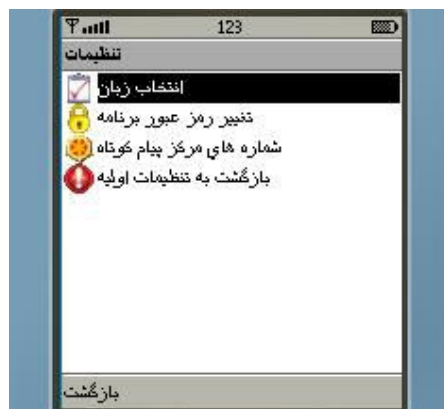
شکل شماره ۳۴

➤ گزینه چهارم "انتقال سرویسها به سیم کارت فعلی" : به منظور منتقل نمودن سرویسهای یکطرفه ثبت نام شده قبلی به سیم کارت دیگر ، ابتدا سیم کارت جدید را در گوشی تلفن همراه خود قرار داده و پس از اجرای همراه بانک ، از طریق این گزینه شماره و رمز یکی از حسابهای خود را درج و درخواست خود را ارسال نمایید. در صورت صحت اطلاعات وارد شده ، کلید سرویسهای یکطرفه فعال شده بر روی سیم کارت اولیه به سیم کارت جدید منتقل می گردد (شکل شماره ۳۳).