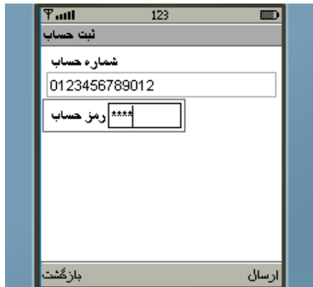
شکل شماره ۶

توجه : در صورت تمایل به تغییر رمز حساب خود می‌توانید با استفاده از منوی "حساب‌ها" گزینه "تغییر رمز حساب" را انتخاب نموده و پس از درج اطلاعات خواسته شده از جمله رمز دلخواه ۴ رقمی درخواست خود را ارسال نمایید. پس از دریافت رمز حساب با رفتن به منوی "حساب‌ها" (شکل شماره ۵) و انتخاب گزینه "ثبت حساب"، شماره حساب ۱۳ رقمی و رمز حساب دریافتی خود را در کادر مربوطه وارد نموده و دکمه ارسال را انتخاب نمایید (شکل شماره ۶).