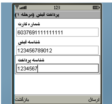
شکل شماره ۱۸

کلیه دارندگان کارت بانکه‌های عضو شتاب با قابلیت فعال سازی رمز دوم کارت، بدون نیاز به ثبت نام و به روش زیر می توانند قبوض خدماتی ( آب، برق، گاز، تلفن ثابت و همراه و ...) دارای شناسه های قبض و پرداخت خود را از طریق این سیستم پرداخت نمایند.