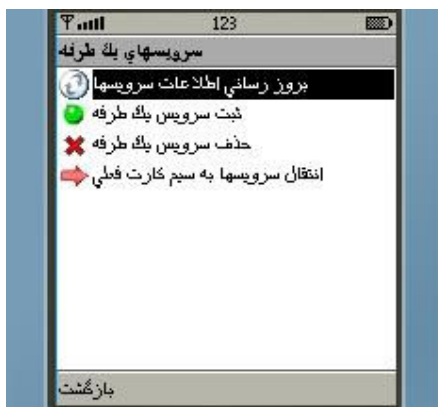
شکل شماره ۹

اگر کاربر قبلی سیستم می‌باشید (حساب خود را قبلا در سیستم ثبت کرده‌اید) ولی اطلاعات حسابها یا سرویسهای یکطرفه شما بر روی گوشی وجود ندارد، نیاز دارید که این اطلاعات را بروز رسانی نمایید. برای این کار از منوی "حسابها" گزینه "بروز رسانی اطلاعات حسابها" (رجوع به شکل شماره ۵) و از منوی "سرویسهای یکطرفه" گزینه "بروز رسانی اطلاعات سرویسها" (شکل شماره ۹) را انتخاب نمایید.